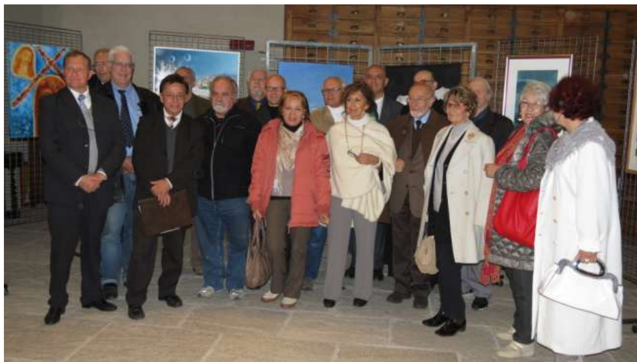
Les artistes réunis