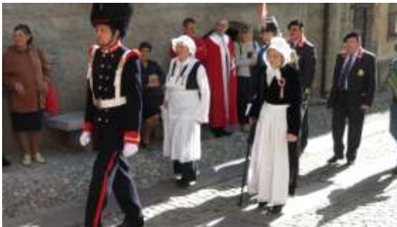
Les divers Groupes et Associations représentés