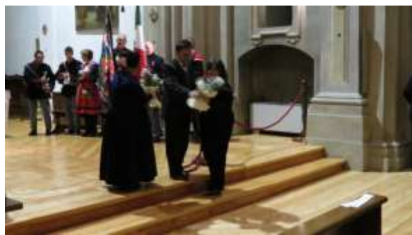
Une ovation de la part du public